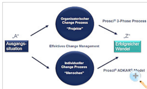
Abb. 2: Leadership / Sponsorship

Telefon: +49 (0)89 / 89 31 61-26 E-Mail: reiner.puch@tiba.de